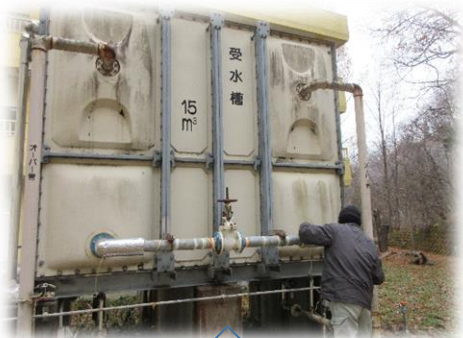
水道管にヒーターを巻きました。

また4・5年生のアンケートの要望からカーテンを洗濯しました。教室のカーテンが少しだけきれい になっていると思います。家庭科室のフライパンも新しく購入し、6年生が調理実習で使用し、 おいしくきれいな料理ができました。