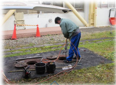
灯油のタンクの検査です。