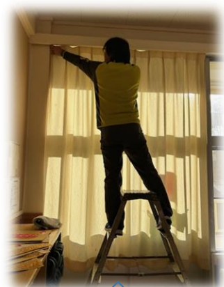
洗濯したカーテンをつけています。