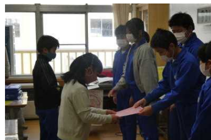
＜パンフレット配付＞

委員会活動では、次年度新たに委員会に参加する3年生に対し、パンフレットを配付するなどし、次年度スムーズに活動へ入れるよう配慮してくれました。