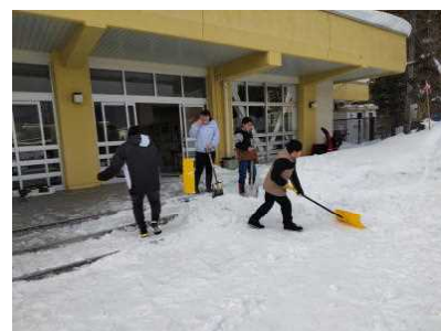
＜除雪ボランティア＞