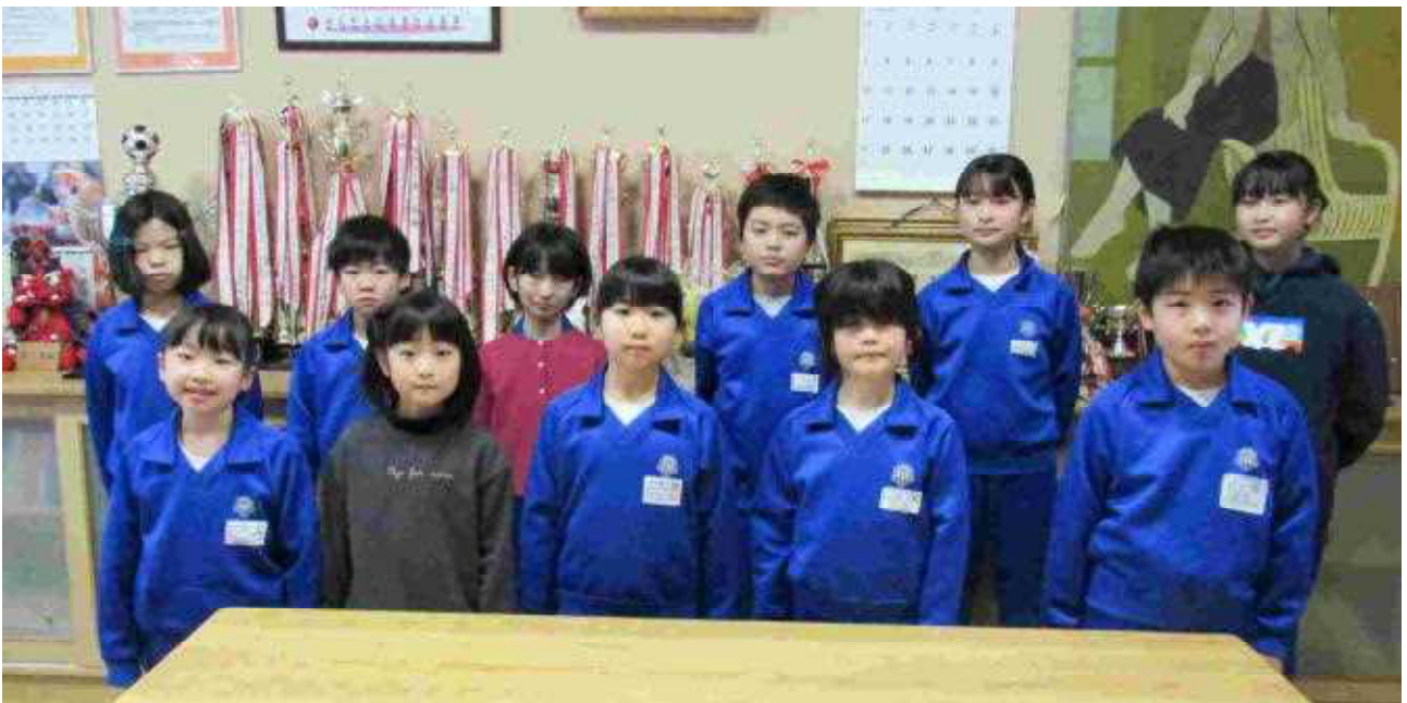
<2 / 1 豆まき集会で、「追い出した鬼」を発表した各学級の代表の皆さん>