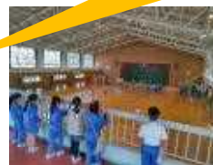
<来年何クラブに入る？>