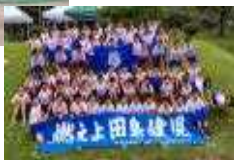
<小体連：病気に負けない体 強い心>