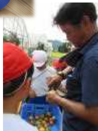
<農家の仕事もいいな>