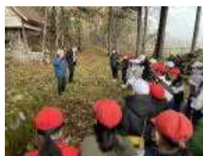
<先人の遺業に触れて>