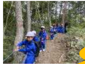
<秋に親しもうでは登山！>