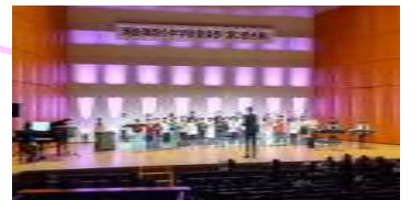
<昨年できなかった鼓笛パレード。 郡演奏祭では、持てる力を発揮>