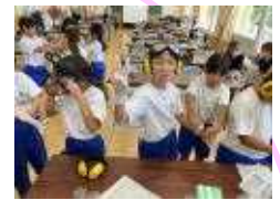
<認知症サポーター養成講座>