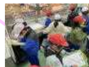
<縦割り活動> お兄さんお姉さんのやさしさ見つけた！ <スーパーの秘密見つけた！>