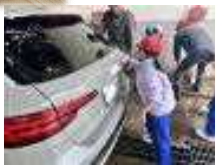
<ガソリスタンドで>