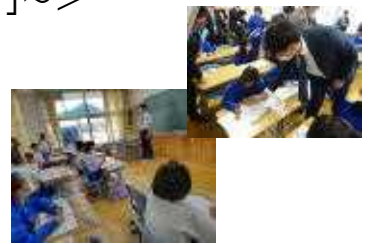
<ぜひ学校の先生に>