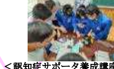
<認知症サポーター養成講座> <もみじ給食> お年寄りなどの大変さを見つけた！