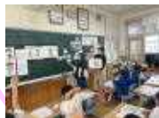
「災害に負けないぞう」>