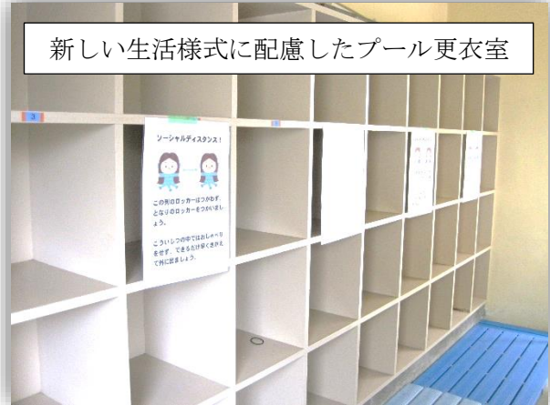
新しい生活様式に配慮したプール更衣室