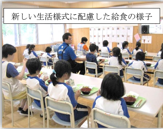
新しい生活様式に配慮した給食の様子