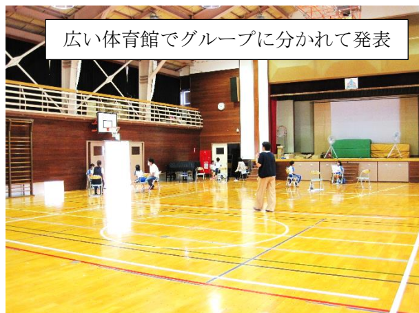
広い体育館でグループに分かれて発表

4月17日に予定していた授業参観が新型コロナウイルス感染症拡大防止のために中止になったこともあり、授業参観の後に保護者全体会、学年懇談会、PTA専門委員会がありました。さらに、育成会役員会と続きました。すべてのご家庭の出席に感謝申し上げます。ありがとうございました。