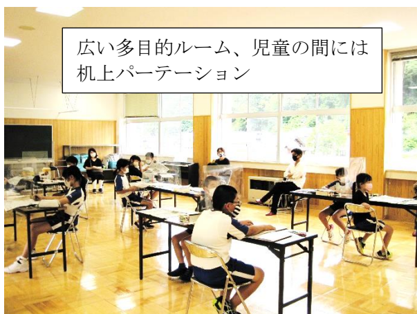
広い多目的ルーム、児童の間には 机上パーテーション

保護者全体会では、PTA会長のあいさつとPTA保護者役員自己紹介がありました。次に、学校教職員紹介と学校長あいさつがありました。その他、主なものとして水泳学習及び夏季休業中のプール開放について説明がありました。