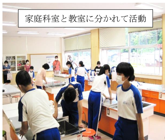
家庭科室と教室に分かれて活動

授業参観をはじめ、保護者全体会、各会において、新しい生活様式に配慮した運営にご協力いただきありがとうございました。