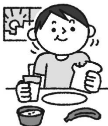
きそくただ せいかつ 規則正しい生活で たいちょうかんり 体調管理