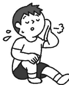
うんどう 運動するときは こまめに休憩を