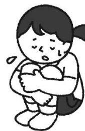
たいちょう ある 体調の悪いときはむりに うんどう 運動しない