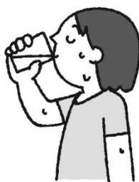
すいぶん 水分はこまめに、 かいすう おお 回数を多めにとる