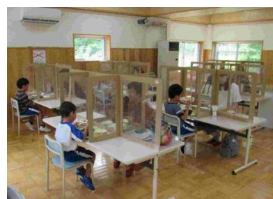
<1年生保護者給食試食会>