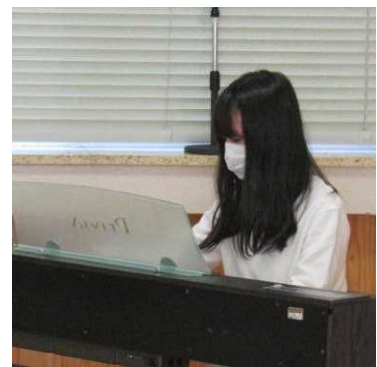
<6年児童代表の発表>