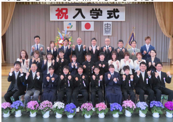
【荒中ポーズでパシャリ！】