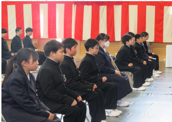
【真剣な眼差しの新入生】

4月6日（木）に10名の新入生を迎え、荒海中学校の令和5年度がスタートいたしました。新入生たちは、入学式では緊張した様子でしたが、学級担任からの呼名に対しての返事、そして、立ち上がった時の立派な姿に、中学校生活への期待と、頑張ろうとする熱い思いが感じられ、胸が熱くなりました。