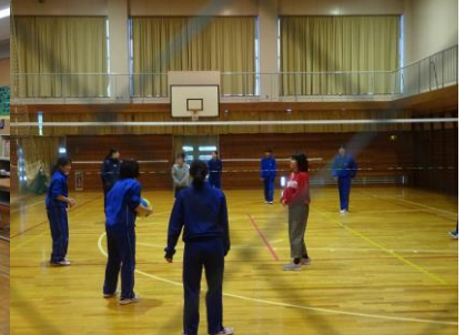
部活動体験の様子