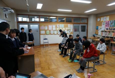
生徒会からの学校説明