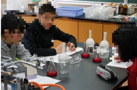
理科の体験授業の様子

最後に部活動見学会があり、中学生と一緒に活動をしていました。短い時間での体験入学でしたが、4月からの入学を楽しみにしています。