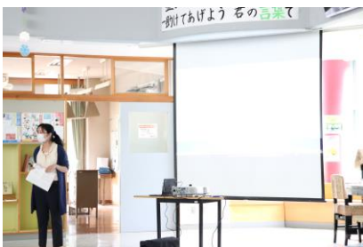
【オリエンテーションの様子】

学習に対する生徒の不安が少しでも解消され、学力向上が図られるよう学校全体で取り組んでいきますので、保護者の皆様のご理解、ご協力をお願いいたします。