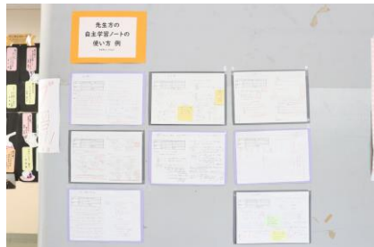
【先生方の自主学習の例】