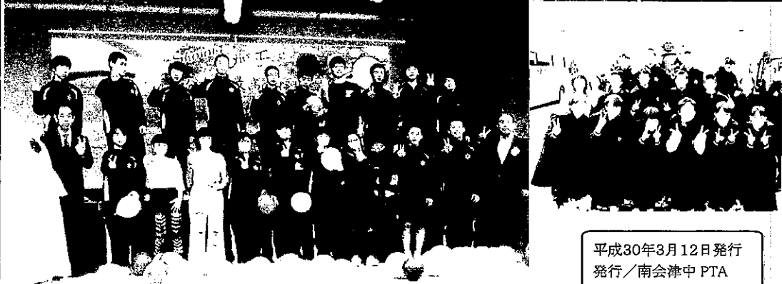
平成30年3月12日発行 発行/南会津中 PTA 編集/PTA 教養委員会